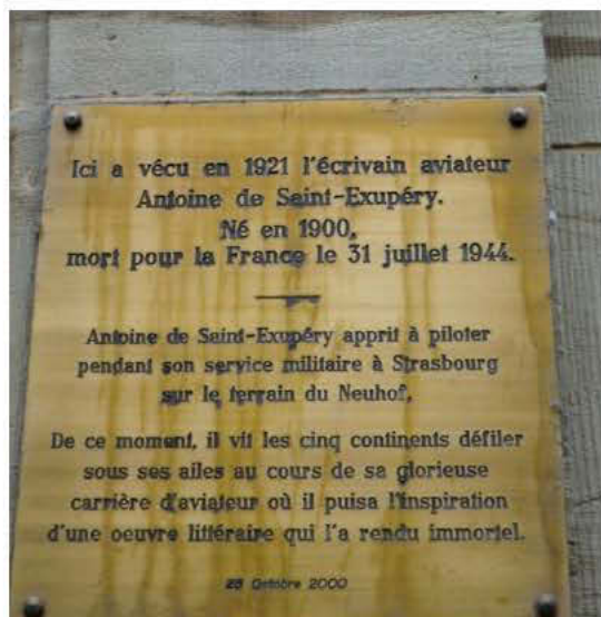
plaque du 12 de la rue du 22 novembre

En avril 1921 arrive à Strasbourg une nouvelle recrue, Antoine de SAINT-EXUPERY, pour effectuer son service militaire au sein du 2ème Régiment d'Aviation. Attiré par l'aviation, Antoine de SAINT-EXUPERY en profita pour apprendre à piloter auprès d'une société privée présente sur le terrain.