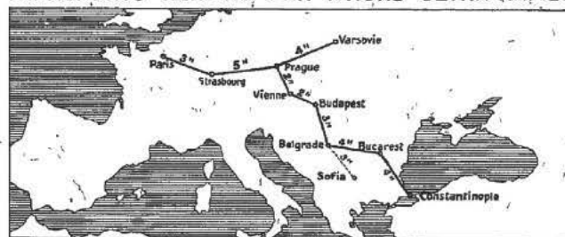
R. C. Seine 56.809.

COMPAGNIE FRANCO-ROUMAINE DE NAVIGATION AÉRIENNE 22, rue des Pyramides, PARIS TRANSPORTS AÉRIENS PAR AVIONS ULTRA-RAPIDES